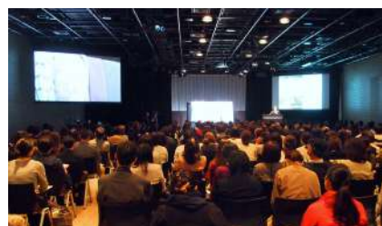
2018年東京開催の様子

日本を代表するテキスタイルメーカー各社のマーケティング・商品開発担当者より、自社製品の開発背景やセールスポイント、コーディネート提案などを聞くことができます。