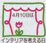
インテリアを考える日

尚、記念ブースにお立ち寄り頂い たお客様、毎日先着1000名様に、 「4月10日はインテリアを考える日」 新ロゴマークにちなんで、 チューリップの球根をプレゼント!