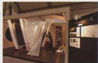
第5回インテリアデザインコンペ2008

新しいライフスタイルを予感させる空間を1/6 スケールの展示ボックスで観合います。