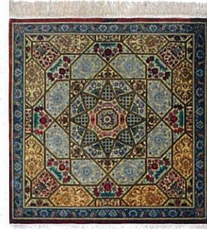
ペルシア絨毯クム産 101×103cm