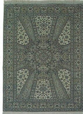
ペルシア絨毯ナイン産 215×301cm

ゴンバドとはペルシア語で、モスクのドーム、丸屋根を指します。ゴンバド文様とはモスクの丸天井を下から見上げたような意匠です。美しい彩釉タイルで飾られた丸天井は、イスラームの建築美を代表するもので、その幾何学的な連続性と対称性は究極の装飾美ともいわれています。中心のメダリオンから放射状に広がるアラベスク文様は、無限の宇宙や神の世界を彷彿とさせるようです。精緻なデザイン感覚と正確な織りが要求されるため、都市工房の織り匠が好んで手がけるデザインです。