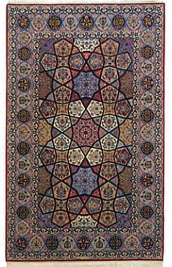
ペルシア絨毯イスファハン産 158×257cm