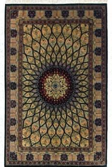
ペルシア絨毯クム産 98×155cm