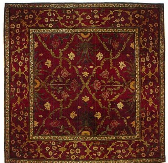
格子草花文絨毯 / ムガル朝 17世紀中期 北インド、ラーホールまたはカシミール