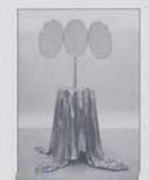
木村浩一郎氏 新作 [mirromirromirror]

せんだいデザイン・ウィーク2008は、デザインに関係する団体会員、企業会員、個人会員、学生会員が総結集し、展示発表します。仙台のデザインシーンを語る刺激的で個性的な作品の数々を堪能してください。仙台でしか味わえない伝統と革新性に富んだ数々のプロジェクトを経験していただけるように考えております。建築、インテリア、ディスプレイ等の空間系、プロダクトデザイン、クラフトデザイン、グラフィックデザイン、写真、映像、メディアアートやインスタレーション等も含め様々なクリエイティブの世界を楽しんでいただけます。特に、仙台在住の世界的に活躍しているアーティスト木村浩一郎氏の新作を来年のミラノサローネに先駆けて発表する予定です。お楽しみに!