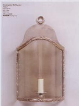
WLA 33/N ウォール・ランタン ニッケル1灯 189,000円(税抜き)