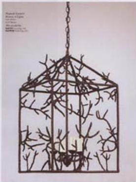
CLA 79/BZ ネブチューン・ランタン ブロンズ4灯 特注で 1,160,000円(税抜き)